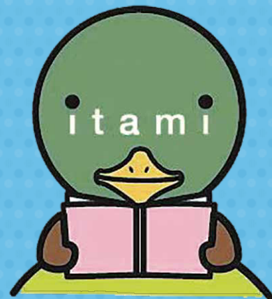
伊丹市マスコット たみまる