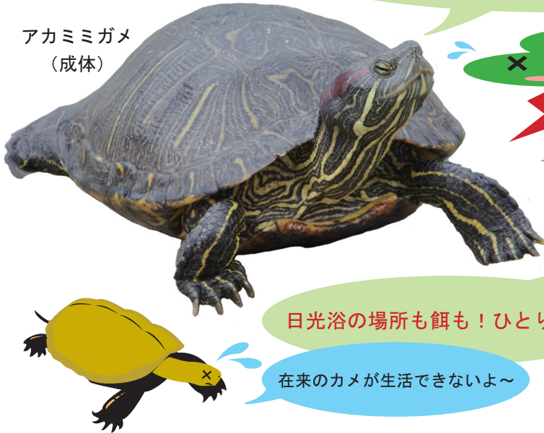
アカミミガメ (成体)