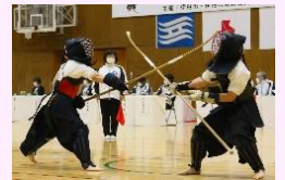
全国高等学校なぎなた選抜大会