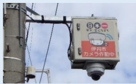
まちなかミマモルメ