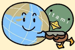
伊丹市ゼロカーボンシティ宣言