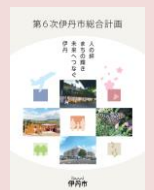
第6次伊丹市総合計画