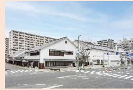
市立伊丹ミュージアム