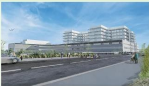
統合新病院イメージパース