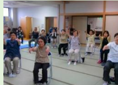
いきいき百歳体操