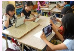
タブレット端末での授業