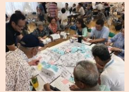
地域自治組織の活動