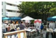
中心市街地活性化協議会が行うイ ベントに補助金を出します。(例)ま ちなかバル、朝マルシェ、冬の元氣 まつりなど

政策目標3「にぎわいと活力にあふれるまち」では、伊丹の魅力を発信するということで、シティプロモーション推進事業の充実化、活力ある地域産業の振興では、中心市街地活性化事業支援の継続として、民間活力で実施しているイベント等をさらに支援していくとされています。