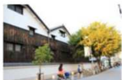
ブルワリービレッジ 長寿館 日本酒文化をPRするために、阪神 間合同で日本遺産登録を目指す!