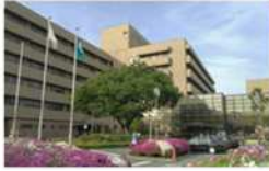
市立伊丹病院のあり方検討委員会 伊丹・宝塚・川西市と近畿中央病 院で意見交換をします。