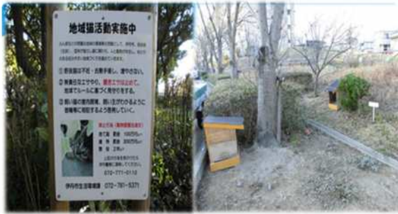
右 : 地域猫用トイレ 毎日手入れします。糞はゴミに出します。 左 : 地域猫活動やってます、看板。 ちゃんとお世話しているので、大丈夫です!

今年度は、野良猫対策事業をさらに進めるために、野良猫450匹、地域猫50匹分の手術費を補助する予算を取っています。また、この補助金を受けるには、説明会で野良猫対策事業についての講習を受けることが義務付けられており、手術をしたからといって、勝手な餌やりなどは慎むなどの注意事項を守らなければなりません。