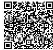
特別定額給付金事業推進班 ホームページ(QRコード)

<参考> 令和2年4月20日現在、対象者は203,353人、対象世帯は91,705世帯