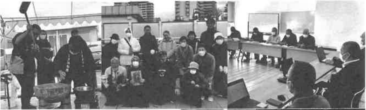
[写真説明 左上から時計回り]