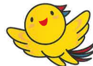
兵庫県マスコットはばタン

兵庫県内で正社員として働きたい方を対象に 兵庫県内で正社員採用をしている企業とのマッチングを促進するプログラムです。 経験者を求める求人から未経験で応募できる求人等、様々な業種・職種の人材と出会うチャンスです。 新たな仕事にチャレンジしたい方の参加をお待ちしております。