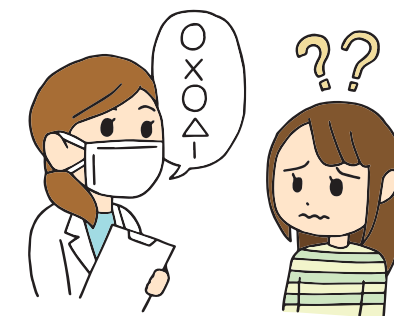
マスクをして話されるとわかりません。