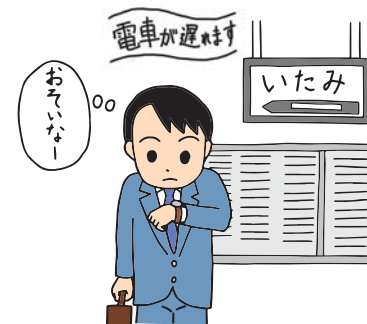
緊急時の放送が聞こえません。