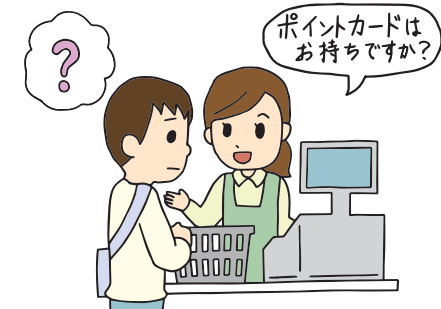
レジで話しかけられても聞こえません。