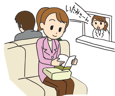
待合室での呼び出しが聞こえません。