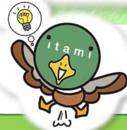
伊丹市マスコット たみまる

伊丹市では、一定の条件を満たす空き家を購入し、居住用として活用される世帯に対し改修工事費の一部を支援します!!