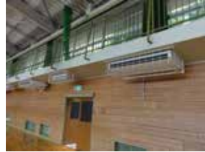
体育館空調設置<イメージ>

体育活動や部活動時の熱中症予防と、避難所環境の向上を目的として、令和6年度から2カ年をかけ、全ての市立小・中・高等学校の体育館に空調設備を整備します。