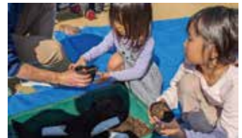
植林用苗木づくり

島根県飯南町・大阪府阪南市と協働して、温室効果ガス削減効果を価値化したカーボンクレジット創出のため、市民参加型の自然環境保全再生プロジェクトに取り組みます。