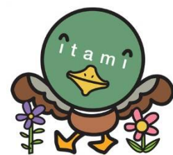
伊丹市マスコット たみまる