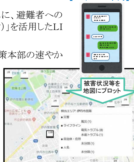
被害情報収集(イメージ)