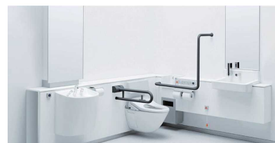
オストメイトに対応した みんなのトイレ(イメージ)