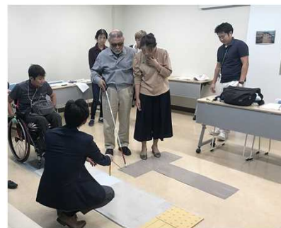
ワークショップ風景

※国が実施する「二酸化炭素排出抑制対策事業費等補助」のうち、災害発生時に活動拠点となる、公共性の高い業務用施設等において、再生可能エネルギー設備や蓄電池等の導入を支援し、停電時にもエネルギー供給が可能なZEB(ネット・ゼロ・エネルギー・ビルディング)の実現と普及拡大を目的とした事業。