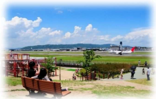
大阪国際空港周辺緑地(伊丹スカイパーク)

その他、公共施設のさらなる活性化を目指し、令和2年度より新たに指定管理者制度を導入する大阪国際空港周辺緑地(伊丹スカイパーク)をはじめ、各施設における管理運営委託料を措置しています。