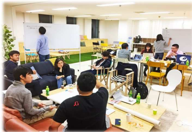
コワーキングスペース (イメージ)

工業用水道事業会計では、昭和40年代に整備し、老朽化が進んでいる工業用配水管について、国の補助金を活用し、来年度に予定していた更新工事を前倒して実施します。