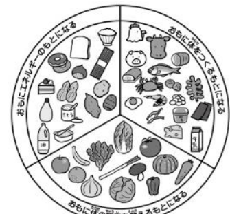
学校給食法第2条を参考に作成