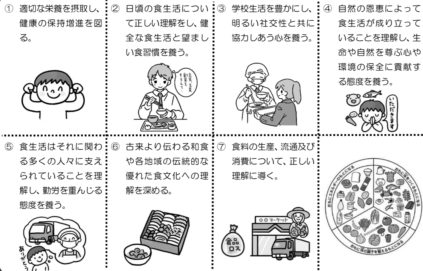
学校給食法第2条を参考に作成