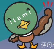
伊丹市マスコット たみまる

恒例の市長・実行委員長による点火式！ 導火線の炎が橋を渡り花火に点火され、花火大会の始まりです。 たみまるの花火と共にスターマインをご覧ください。