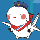
関西エアポートグループ 公式キャラクター 「そらやん」

空をイメージした青い花々 の中に、凛とした一輪の 白牡丹が咲き誇ります。 今夜だけの特別な空中庭園に ご招待いたします。