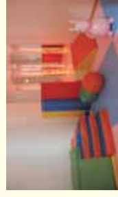
スナックズレン室