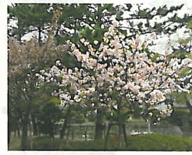
たんたん小道 てまり桜