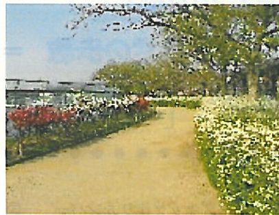
瑞ヶ池 南京桃・雪柳