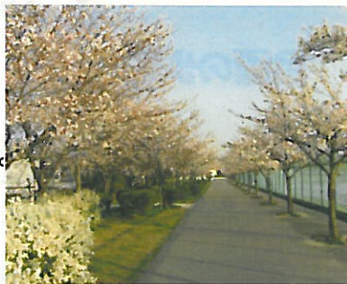
瑞ヶ池東端 桜並木