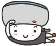
安全・安心見守りキャラクター アッチちゃん